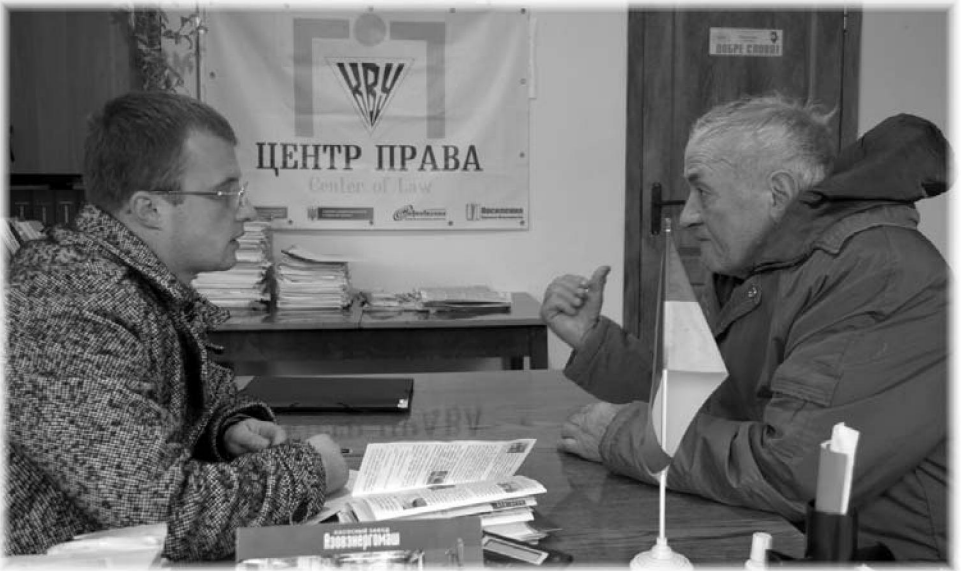
На фото: надання правової консультації під час виїздного прийому (Котовський район)