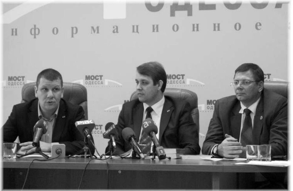
На фото: спільна прес-конференція Одеської обласної організації КВУ та Головного управління юстиції в Одеській області