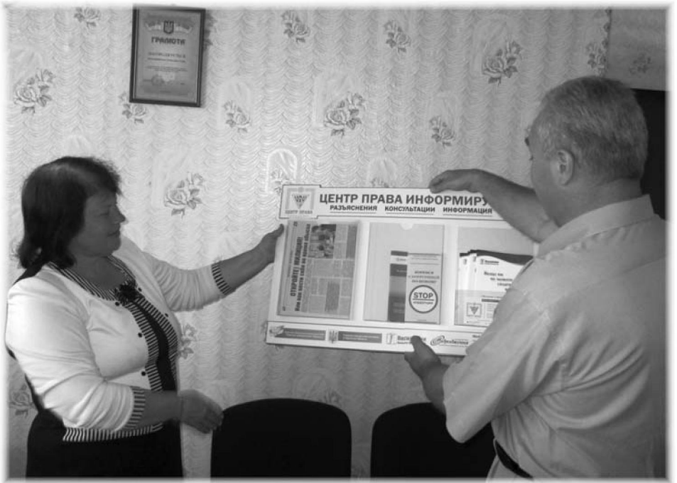
На фото: розміщення інформаційного стенду в приміщенні сільської ради (Саратський район)