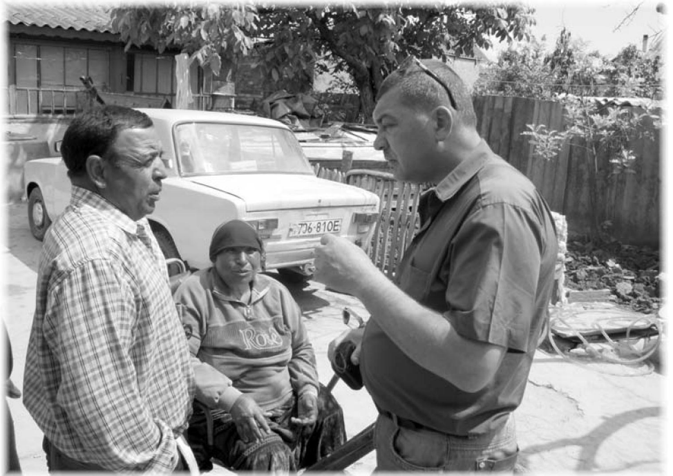
На фото: зустріч з представниками ромської громади (м. Татарбунари)